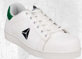
SMASH S1P SRC