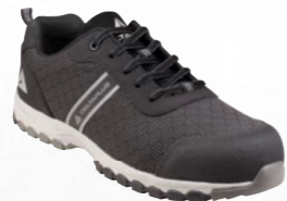
BOSTON S1P SRC