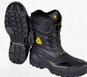
ESKIMO SBHP SRC