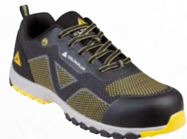
MEMPHIS S1P SRC