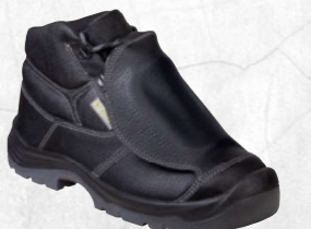
MIWA S3 SRC