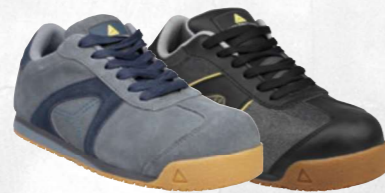
D-SPIRIT S1P SRC