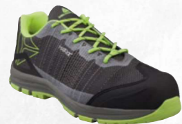
DELTA FLY S1P SRC