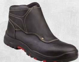
COBRA4 S3 SRC