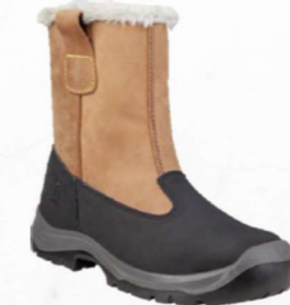
TAKU S3 SRC