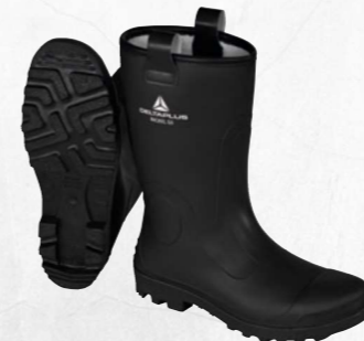
NICKEL S5 SRC