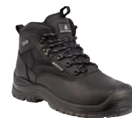
SAMY2 S3 SRC