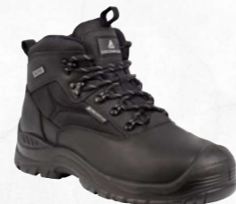
SAMY2 S3 SRC