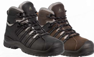
NOMAD2 S3 SRC