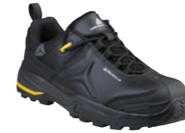
TW302 S3 SRC