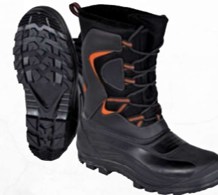
LAUTARET OB SRC