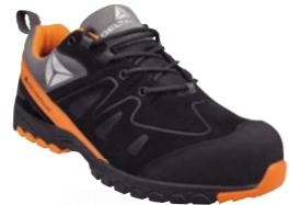
BROOKLYN S3 SRC