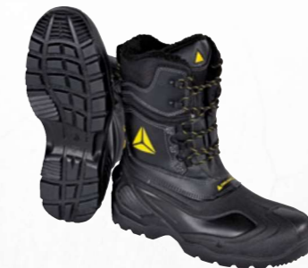
ESKIMO SBHP SRC