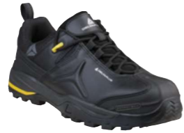
TW302 S3 SRC