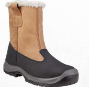
TAKU S3 SRC