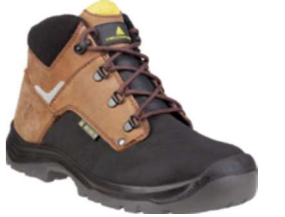
GOBI S3 SRC