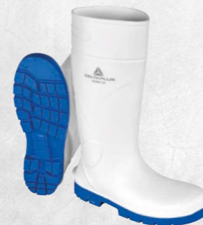
KEMIS S4 SRC