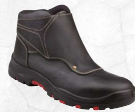
COBRA4 S3 SRC