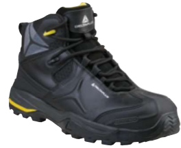
TW402 S3 SRC