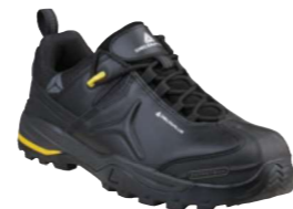
TW302 S3 SRC