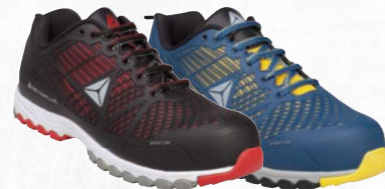
DELTASPORT S1P SRC