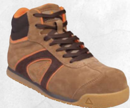
D-STAR S1P SRC