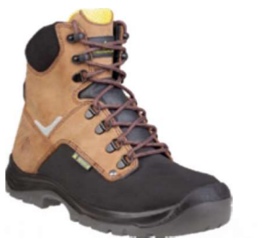
ATACAMA S3 SRC