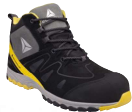
MANHATTAN S3 SRC